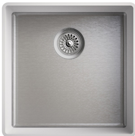
MASSBLATT MIXA-R10 813