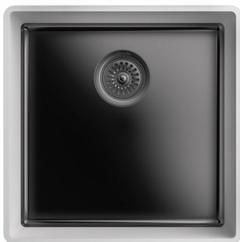
MASSBLATT MIXA-R10 813 BL