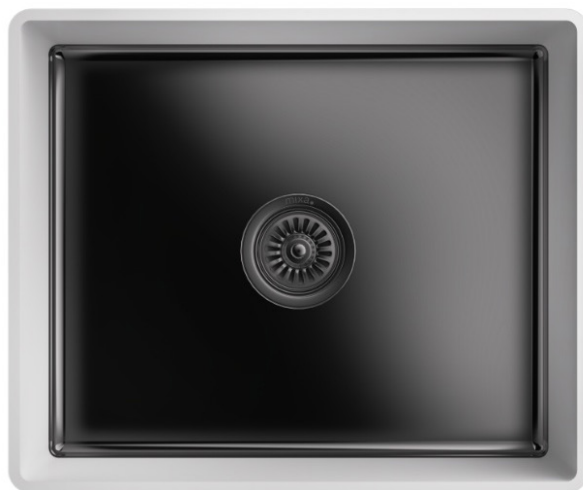
MASSBLATT MIXA-R10 871 BL